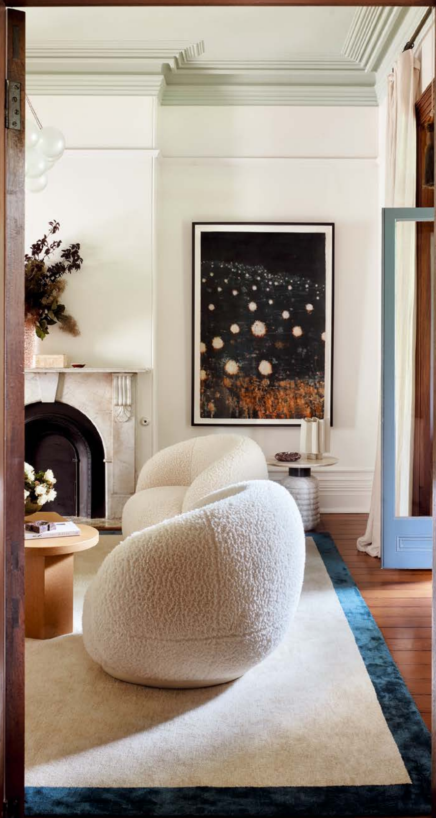
Beige, aber nicht belanglos: Das Interiordesign-Studio Arent & Pyke weiß um die richtige Balance (www.arentpyke.com)

Fotos: Anson Smart / Styling; Claire Delmar; Studio CD (1). Alle Preise unverbindlich