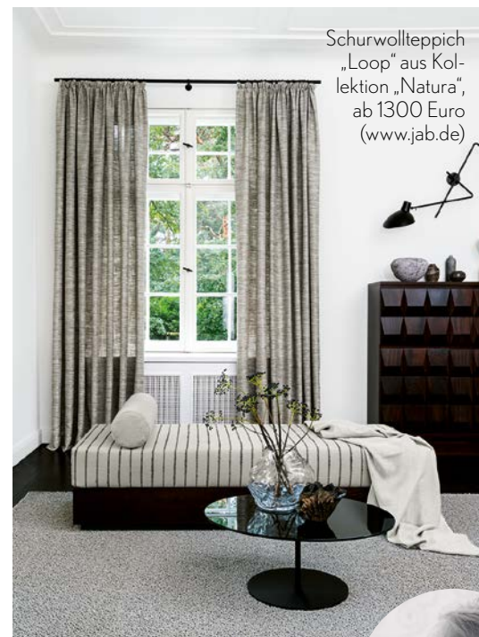
Schurwollteppich „Loop“ aus Kollektion „Natura“, ab 1300 Euro (www.jab.de)